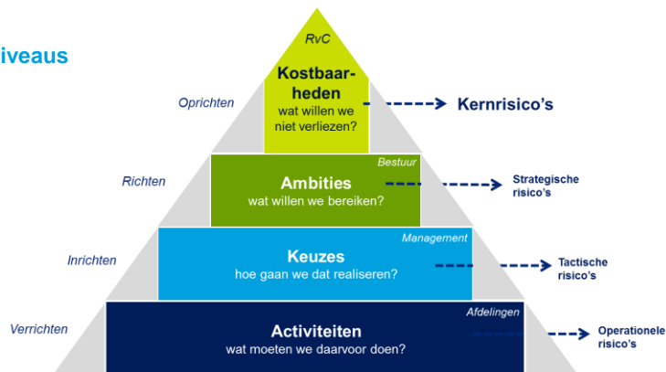
Figuur 1: risiconiveaus

De omstandigheden die het voortbestaan van uw kostbaarheden in gevaar kunnen brengen, noemen wij de kernrisico's van de corporatie. Vanwege hun belang voor het lange termijn succes van de organisatie, worden kernrisico's veelal opgenomen onder de strategische risico's. Deloitte geeft er de voorkeur aan de kernrisico's apart te positioneren, omdat zij zowel qua betekenis als qua inbedding in de governancestructuur verschillen van de strategische risico's (de in- en externe omstandigheden die de realisatie van de ambities kunnen verhinderen).