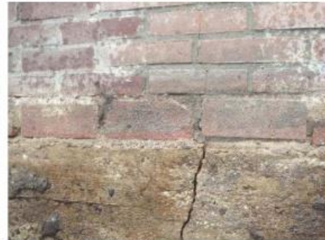
Karel Doormanstraat 40: Scheur funderingsbalk is duidelijk te zien in bovengelegen metselwerk.