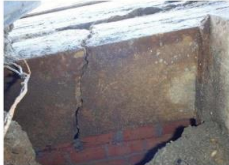
Cor Bruijweg 27: Rondom doorgescheurde funderingsbalk. Deze is reeds 10 mm verzakt.