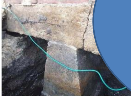
Karel Doormanstraat 40: Scheur funderingsbalk is duidelijk te zie

IvhO gaat het gesprek aan over doelen en visie van bestuur: bewustwording en vertrouwen in kwaliteit.