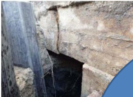
Cor Bruijnweg 27: Rondom doorgescheurde f